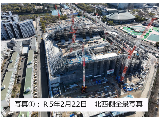
写真①：R5年2月22日 北西側全景写真