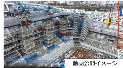
動画公開イメージ