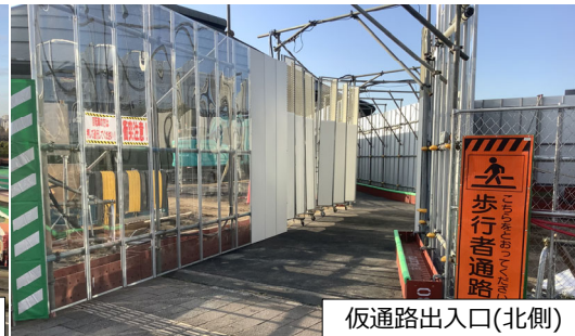
仮通路出入口(北側)