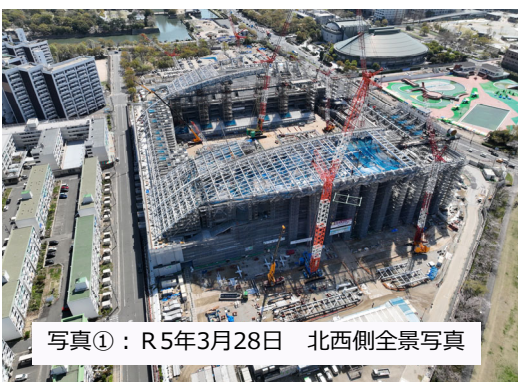
写真①：R5年3月28日 北西側全景写真