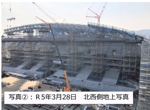
写真②：R5年3月28日 北西側地上写真