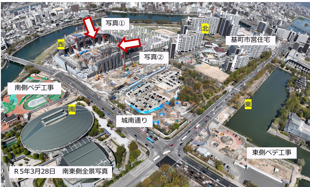
R5年3月28日 南東側全景写真