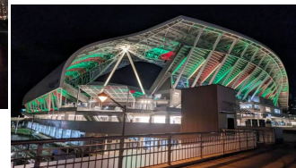
下：クリスマスカラー