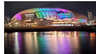
上：レインボーカラー

2023年12月22日～24日の夜に掛けて、クリスマスカラーとレインボーカラーの2パターンの演出照明を点灯しました。クリスマスらしい赤と緑色や、レインボー7色の照明が点灯し、華やかな演出となりました。