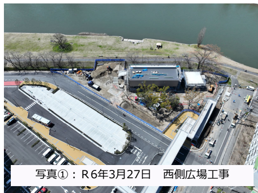
写真①：R6年3月27日 西側広場工事