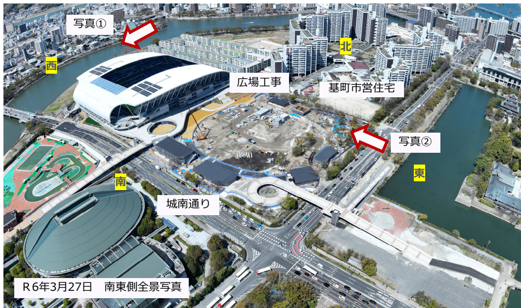
R6年3月27日 南東側全景写真