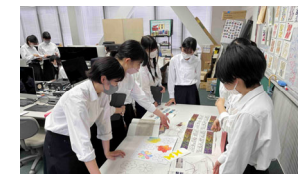
学生たちによる作業風景

基町に面した北側の仮囲いに、基町高校を始めとする地域の子供たちが描いた絵が展示される予定です。全長はおよそ100mにもなる、壮大な絵画となります。9月の完成に向けて鋭意製作中ですので、今しばらくお待ちください。